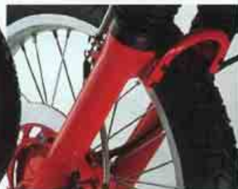
Un arcetou renforce la fourche pour permettre d'aborder tous les terrains.

Le réglage hydraulique du jeu des soupapes. Un dispositif hydraulique qui maintient automatiquement un jeu constant aux soupapes, ce qui supprime tout réglage.