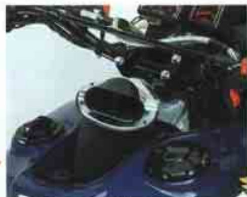
Le filtre à air très accessible est protégé de la poussière. Le cadre fait office de réservoir d'huile.